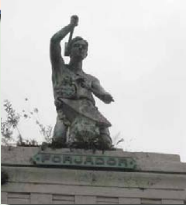
El Forjador, obra diseñada por Gustave Eiffel

“Queremos potenciar el barrio. Tratamos que el visitante pueda llegar a conectarse con lo que pasa en San Telmo. Les ofrecemos recomendaciones, consejos sobre salidas nocturnas, museos, milongas, galerías, etc. Nos gusta hablar de la idiosincrasia, de los nativos y esa mezcla única de gente que hay en nuestro barrio. Queremos que no se pierdan las estructuras de los edificios, defender lo nuestro y que los turistas se enamoren de San Telmo”; agrega Javier.