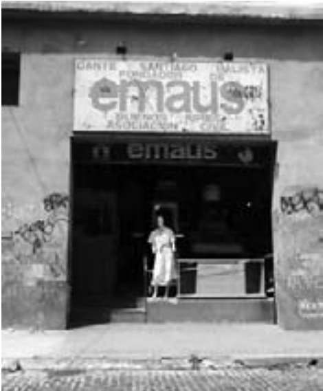
Por Tatiana Michalski

Emaús es un movimiento fundado en el año 1949 por un sacerdote francés, conocido como el Abbé Pierre, para salvar a familias que lo habían perdido todo al finalizar la Segunda Guerra Mundial y que vagaban por las afueras de París, sin techo y sin pan.