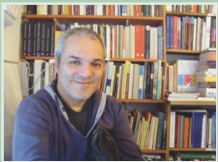
El Librero del Año