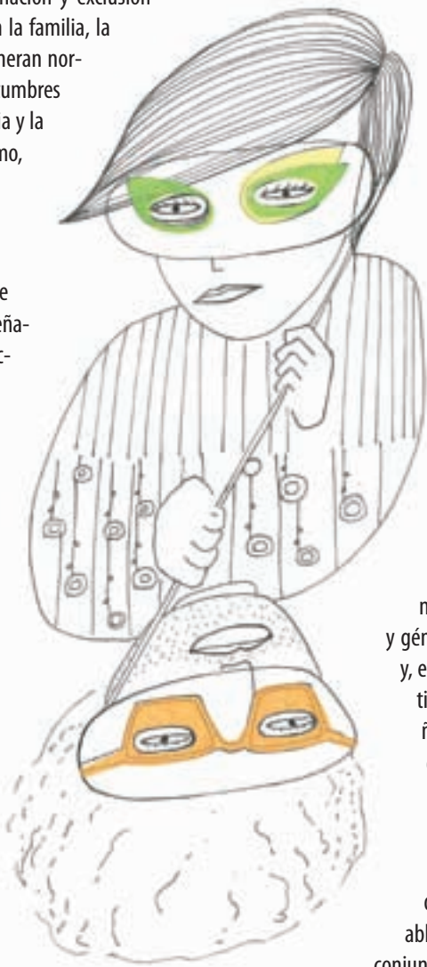
Ilustración: Elvira Amor. por el CCEBA.

Ricardo Ramón Jarne es director del Centro Cultural de España en Buenos Aires, que lanzó el concurso de obras para la puesta en valor de su nueva sede en el predio del ex Padelai (Balcarce 1125). www.cceba.org.ar