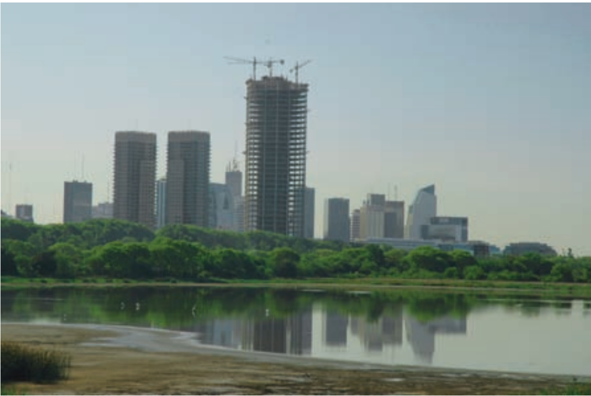
Pág. 6: Áreas de recreación en la orilla del río. Pág. 7: Sendero y vista de una de las lagunas (todavía con agua) en 2006.

Entre sus ambientes se encuentran las lagunas y los bañados interiores (Laguna de los Coipos, Laguna de las Gaviotas, Laguna de los Patos) y pastizales con presencia desparramada de especies arbóreas, arbustos, hierbas y gramíneas. Sólo por nombrar algunos: plumerillos, cortaderales, ceibos, sauces, alisos de río, curupí, sarandí colorado y palmeras. Entre su fauna abundan desde cuises, comadreja, gran variedad de aves (incluyendo cigüeñas, caranchos, carpinteros, cormoranes, garzas, chingolos, cardenales y zorzales), hasta tortugas, lagartos overos, insectos y peces.