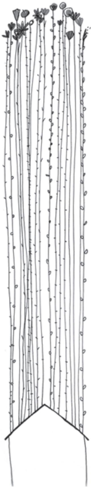
Ilustración: Elvira Amor

Las plazas, parques y plazoletas no solo son para el recreo, descanso o paseo de los vecinos, además, -algunas- simbolizan el homenaje que los habitantes les hacemos a quienes están cerca de nuestros corazones y queremos dejar plasmado ese sentimiento en nuestro hábitat. Por eso, sería bueno que las autoridades y los mismos vecinos las conociéramos, respetáramos y ayudáramos a cuidarlas.