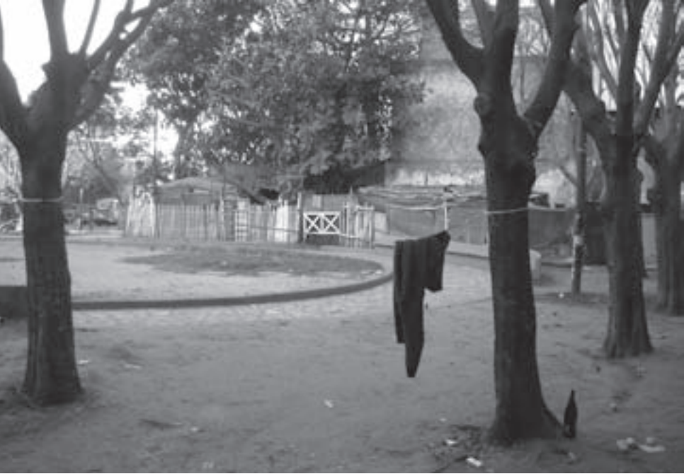
La plaza Rosario Vera Peñaloza y la plaza Cecilia Grierson: a una cuadra una de la otra, pero dos mundos aparte.