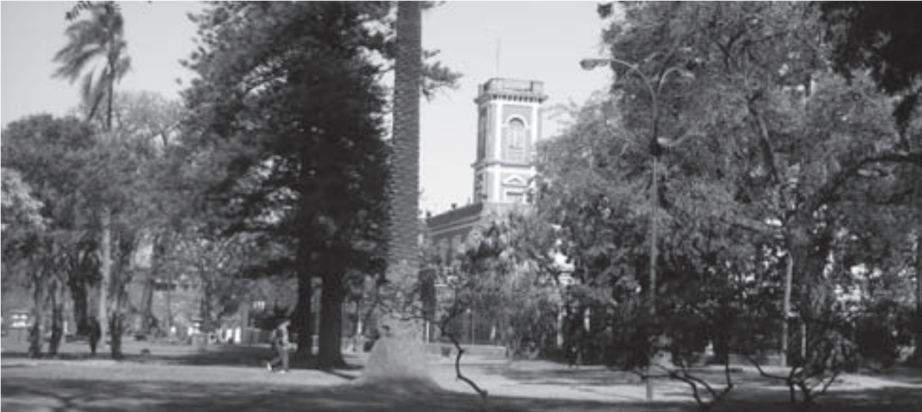
Por Daiana Ducca.

Para más información contactarse a: info@huergo.edu.ar