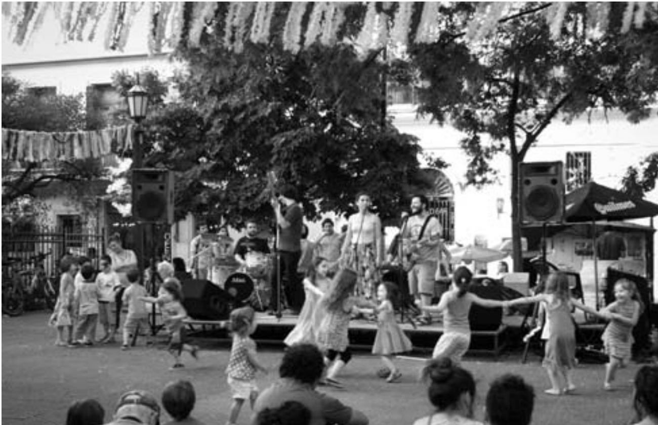
La última edición de la Gran Mateada Barrial en la Plaza Dorrego, noviembre 2011.