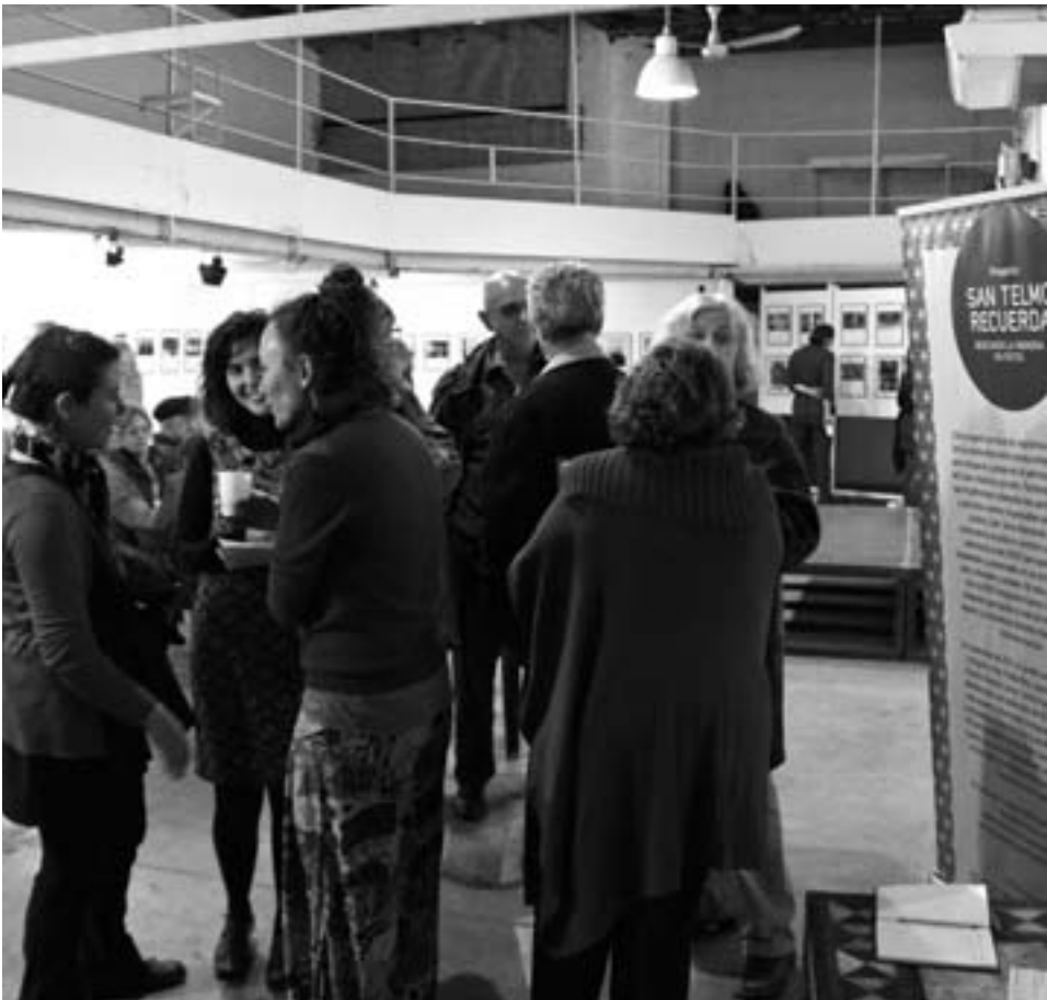
La inauguración de San Telmo Recuerda en el Espacio Giesso.

Desde el jueves 31 de mayo hasta el domingo 3 de junio se realizaron actividades para festejar el 206 aniversario del barrio de San Telmo.