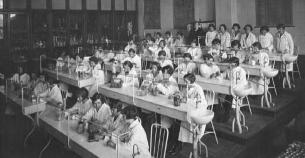
Fotografías antiguas del colegio: gentileza del museo del Normal 3

En 1997 se produjo la jubilación masiva de profesores que dedicaban todas sus horas de cátedra a la Institución, generando así una relación profunda con el alumnado amén de la calidad profesional que ostentaban, lo que originó un quiebre porque esos profesionales fueron reemplazados por otros interinos que tenían muy buena formación pero escasos conocimientos pedagógicos, a lo que se sumaba el hecho de que sus horas de cátedra se desarrollaban en diversos establecimientos al mismo tiempo. Este sistema se generalizó en esa época, perdiéndose así la relación de pertenencia que se daba entre establecimiento-profesor-alumnado, como también el seguimiento integral de cada alumno. A esto se sumó el cambio de perfil de la población escolar. No olvidemos que el Normal ha producido, en su historia educativa, el hecho de que generaciones de familias estudiaran en sus aulas y ese momento provocó que muchas de ellas comenzaran a mandar a sus hijos a colegios estatales más alejados y que, consideraban, conservan su prestigio (Nacional Buenos Aires, Mariano Acosta, etc.) o a escuelas privadas, dejando las vacantes para los