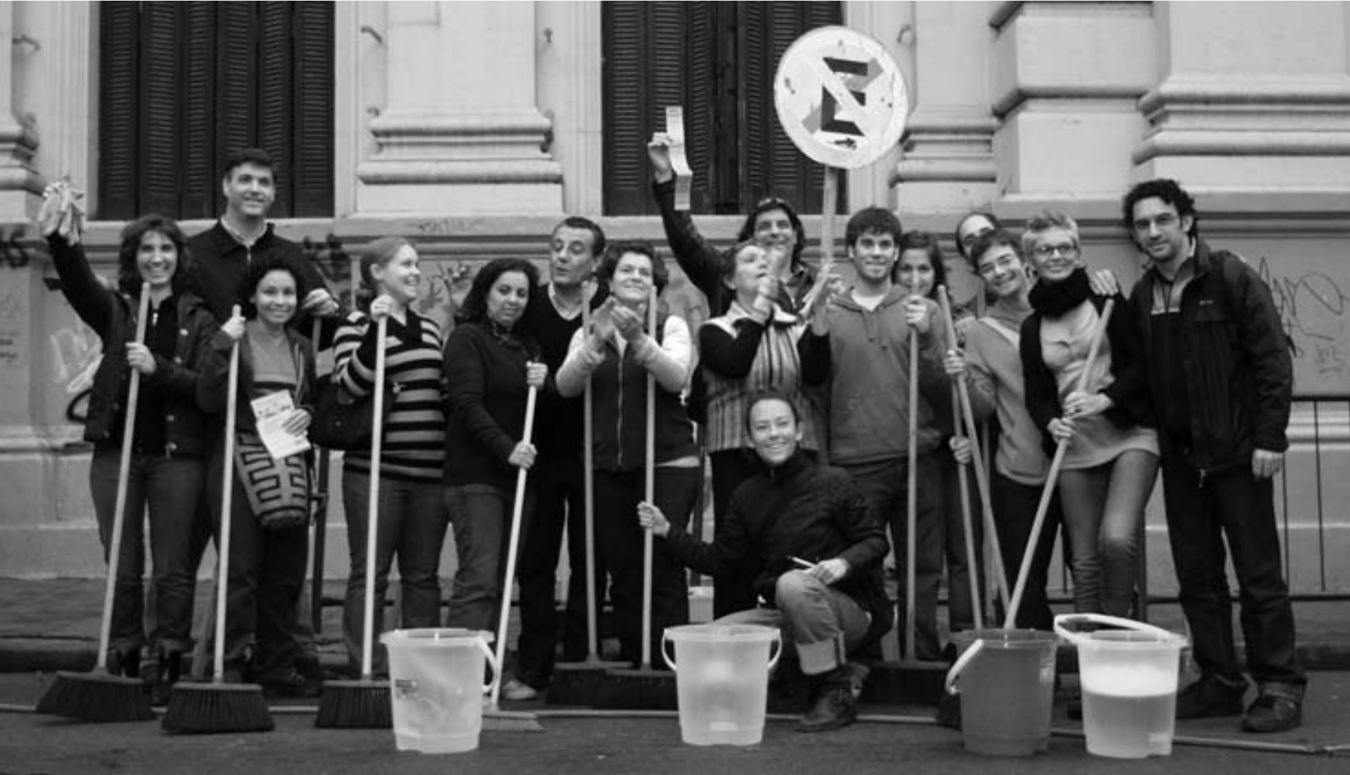
La primera baldeada comunitaria que que El Sol de San Telmo ayudó a organizar..., agosto de 2008.

Esta es mi última nota como directora de El Sol de San Telmo. Después de casi cinco años, este proyecto de comunicación social y construcción comunitaria ha madurado lo necesario para que sea dirigido por los mismos vecinos de este barrio. A pesar de mi deseo de compartir tantas emociones que me genera esta despedida, voy a limitarme a los conceptos claves que guiaron mi labor durante este tiempo. Dado que El Sol de San Telmo no es solo un periódico, pero tampoco una asociación vecinal ni una organización cultural –sumado al hecho de que su directora y editora es extranjera–, creo que para muchas personas clasificar y entender nuestro trabajo comunitario a veces ha sido difícil.