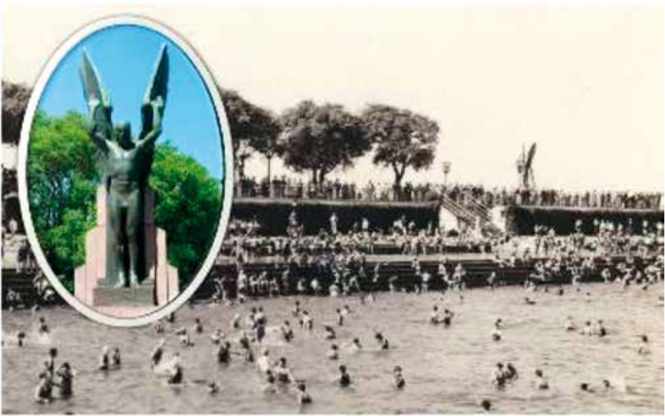
El espigón Plus Ultra unos años después de la inauguración del monumento, que se distingue claramente sobre el extremo derecho de la foto. Sobre el lado izquierdo detalle del Ícaro