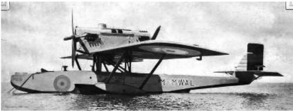
El avión sobre las aguas del Río de la Plata en una fotografía publicada en la nota especialmente dedicada al raid del Plus Ultra en la revista homónima

Pero, como advierte el saber popular, lo bueno no dura para siempre. Llegó el momento de la partida, doblemente doloroso por dos razones. La primera es que intereses políticos de ambas orillas del océano determinaron que el raid se diera por terminado en Buenos Aires, contra la voluntad de los tripulantes que deseaban realizar el regreso ampliando la hazaña en un vuelo circular por los países de la costa pacífica de Sudamérica, México y los Estados Unidos. La segunda es que el hidroavión al que, sin duda, amaban profundamente, fue donado por España a la Argentina y ya no habría forma de volver a volar en él. Se lamenta Franco recordando la partida: “Un gran gentío ocupaba los muelles del Arsenal y toda la extensión del puerto; pero en él no se veían ya aquellas manifestaciones de entusiasmo que veíamos a nuestra llegada. Se veía en el pueblo la tristeza de quien pierde un ser querido. Este perdía sus ídolos, porque en realidad eso fuimos durante nuestra estancia en la Argentina. (...) Cuando el crucero Buenos Aires zarpó con nuestros cuerpos para devolverlos a España, nuestras miradas quedaban fijas en el Plus Ultra, hasta que se perdió de vista con la distancia, asomando entonces una furtiva lágrima a nuestros ojos, por aquel trozo de España que estaba destinado a deshacerse poco a poco en la obscuridad de un hangar o en la fúnebre sala de un museo. Con el pueblo argentino quedaba también nuestro corazón, que había sabido conquistar con la magnitud de su homenaje”.